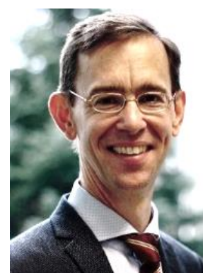
Prof. Dr. Karl Riesenhuber Stellvertr. Vorsitzender